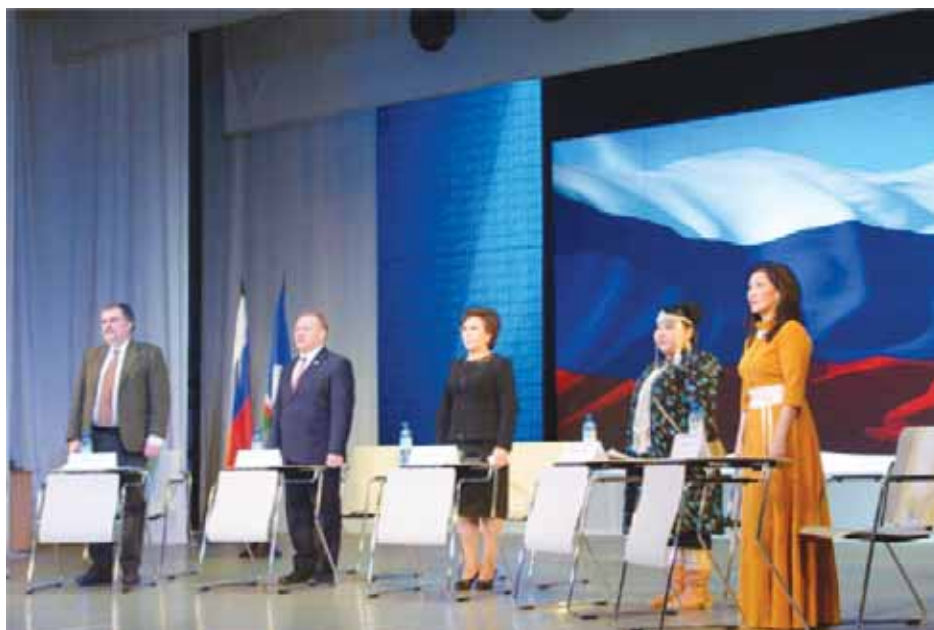
Перед подписанием Меморандума о сотрудничестве между Правительством Республики Саха (Якутия) и ИИТО ЮНЕСКО.