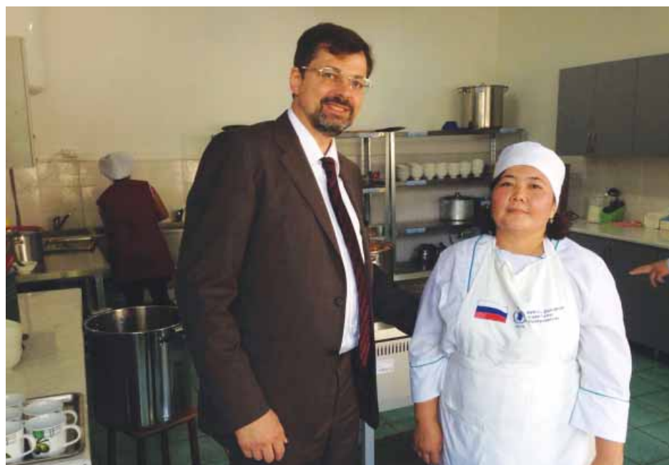
Полевой визит в Киргизию: посещение школьной столовой в рамках проекта ВПП ООН.

Youtube: http://www.youtube.com/user/unicmoscow