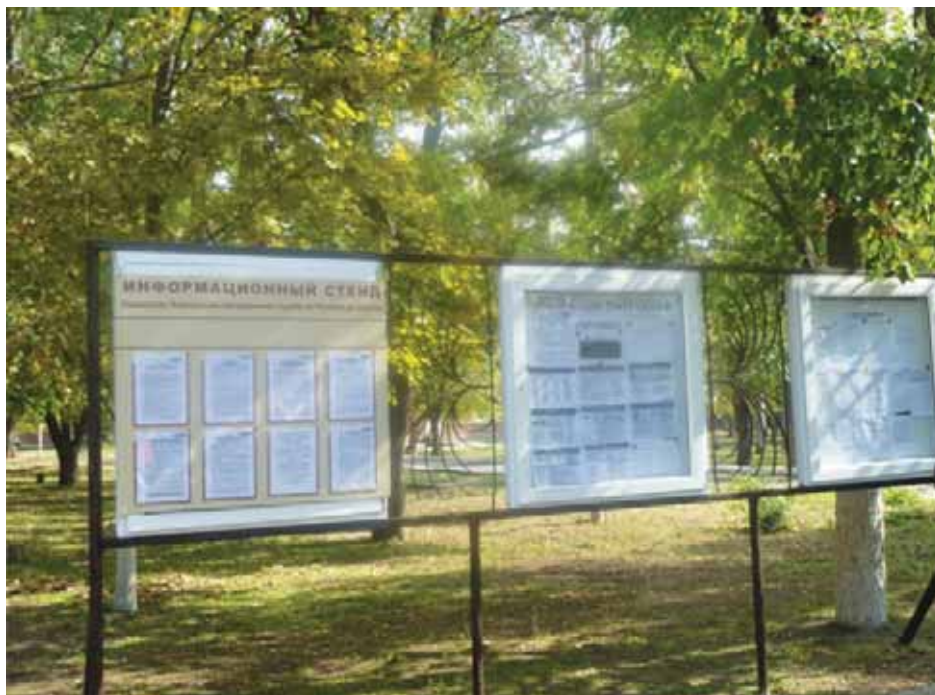
Информационные стенды в одном из пунктов временного размещения беженцев из Украины в Ростовской области.

Вот уже больше года европейские страны говорят о миграционном кризисе и притоке большого количества беженцев и мигрантов из стран Африки и Ближнего Востока. Российская Федерация находится вдалеке от основных миграционных путей и не так привлекательна для беженцев, как другие регионы Европы. Вместе с тем необходимо отметить, что цифры за 2014 и 2015 год вполне сопоставимы: к началу 2016 года свыше миллиона беженцев прибыли на территорию Евросоюза, а Россия за тот же период времени стала страной убежища для свыше миллиона человек с юго-востока Украины.