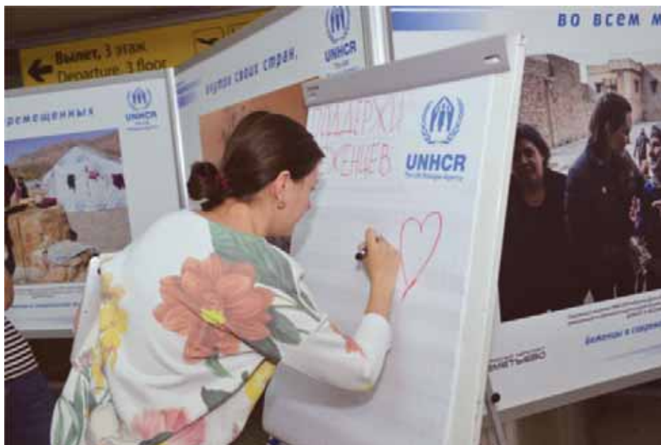
Фотовыставка и акция в поддержку беженцев в Международном аэропорте Шереметьево-2 в июне 2015 г.

Во время украинского кризиса все силы российского правительства были брошены на решение проблем беженцев с юго-востока Украины, в то время как выходцы из других стран мира, ищущие убежище в России, оказались, в определенной степени, в невыгодном положении. До настоящего времени их доступ к процедуре поиска убежища весьма затруднен в Москве, Московской области и Санкт-Петербурге: без присутствия адвоката лицо, ищущее убежище, практически не имеет шансов полу-