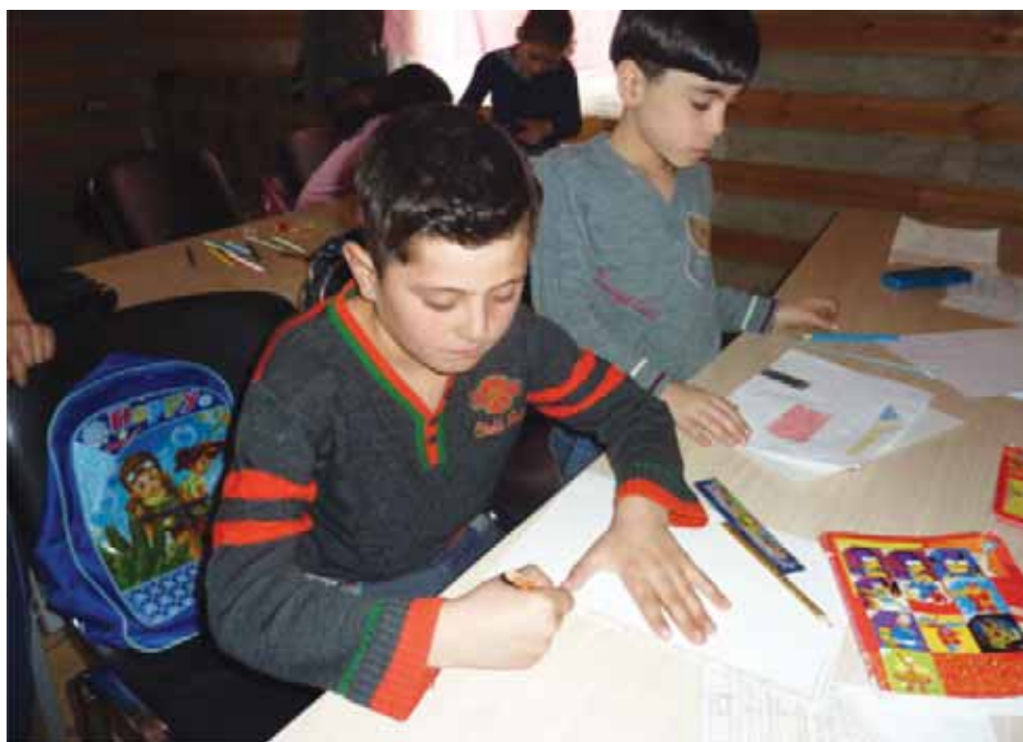
Дети сирийских беженцев в Подмоскowie надеются, что будут учиться вместе с российскими сверстниками.

Конвенция о правах ребенка, которую Россия ратифицировала 15 сентября 1990 года, фиксирует право на получение бесплатного начального и среднего образования. Это касается и детей беженцев. Вместе с тем, для зачисления детей в школу с родителей (лиц, ищущих убежище) зачастую требуют подтверждение регистрации по месту жительства (что в случае соискателей убежища практически невозможно). К сожалению, в ряде регионов России такие случаи приобретают массовый характер и находятся на контроле УВКБ ООН. Так, в 2015 году УВКБ ООН совместно с партнерами из числа НКО провело большую работу в Московской области (в частности, в городском поселении Лосино-Петровский) и добилось зачисления детей сирийских беженцев в местную школу после тестирования, определения уровня их подготовки и обучения основам русского языка. Перечисленные выше пробелы являются предметом регулярного обсуждения с миграционными органами Российской Федерации. Хочется выразить надежду, что страна, предоставившая помощь и убежище свыше одному миллиону человек, бежавших с юго-востока Украины, также сможет найти решение для нескольких тысяч беженцев из других частей света.