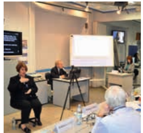
Вариант трансформации аудитории для проведения научно-образовательных мероприятий

Эффективность этих подходов подтверждается на практике. И, несмотря на то, что рассмотренный аудиторный комплекс является лишь одним из модулей обеспечения доступности образовательного процесса, он может служить удачным примером системной интеграции передовых возможностей ИКТ и эффективного использования потенциала интеллектуальных решений. Применяемые технологии и инновационные образовательные подходы позволили Центру вырасти до статуса федерального учреждения по проблемам высшего образования людей со специальными потребностями по слуху, где МГТУ им. Н.Э. Баумана по праву является одним из общепризнанных мировых лидеров.