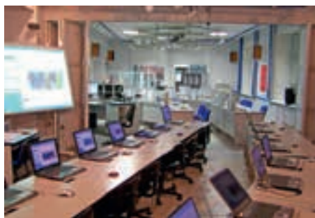
Общий вид мультимедийного аудиторного комплекса.

Ч тобы образовательно-реабилитационный процесс был успешным, для глухих и слабо слышащих студентов в вузе создана доступная среда, основными элементами которой являются экологичность и безопасность, физическая доступность корпусов, аудиторий и общежитий, информационно-содержательная доступность образовательных программ и их реабилитационное сопровождение.