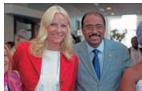
Ее Королевское Высочество кронпринцесса Норвегии Метте-Марит и Исполнительный директор ЮНЭЙДС Мишель Сидибэ после награждения Red Ribbon Award во время специальной сессии на Международной конференции по СПИДу в Вашингтоне, округ Колумбия, 25 июля 2012 года

Во время специальной сессии для вручения премии «Красная лента» победителей поздравили многие видные деятели, в том числе г-н Сидибэ, посол доброй воли ЮНЭЙДС Ее Королевское Высочество кронпринцесса Норвегии Метте-Марит, конгрессмен США Джим МакДермотт, министр здравоохранения и социальной защиты Франции