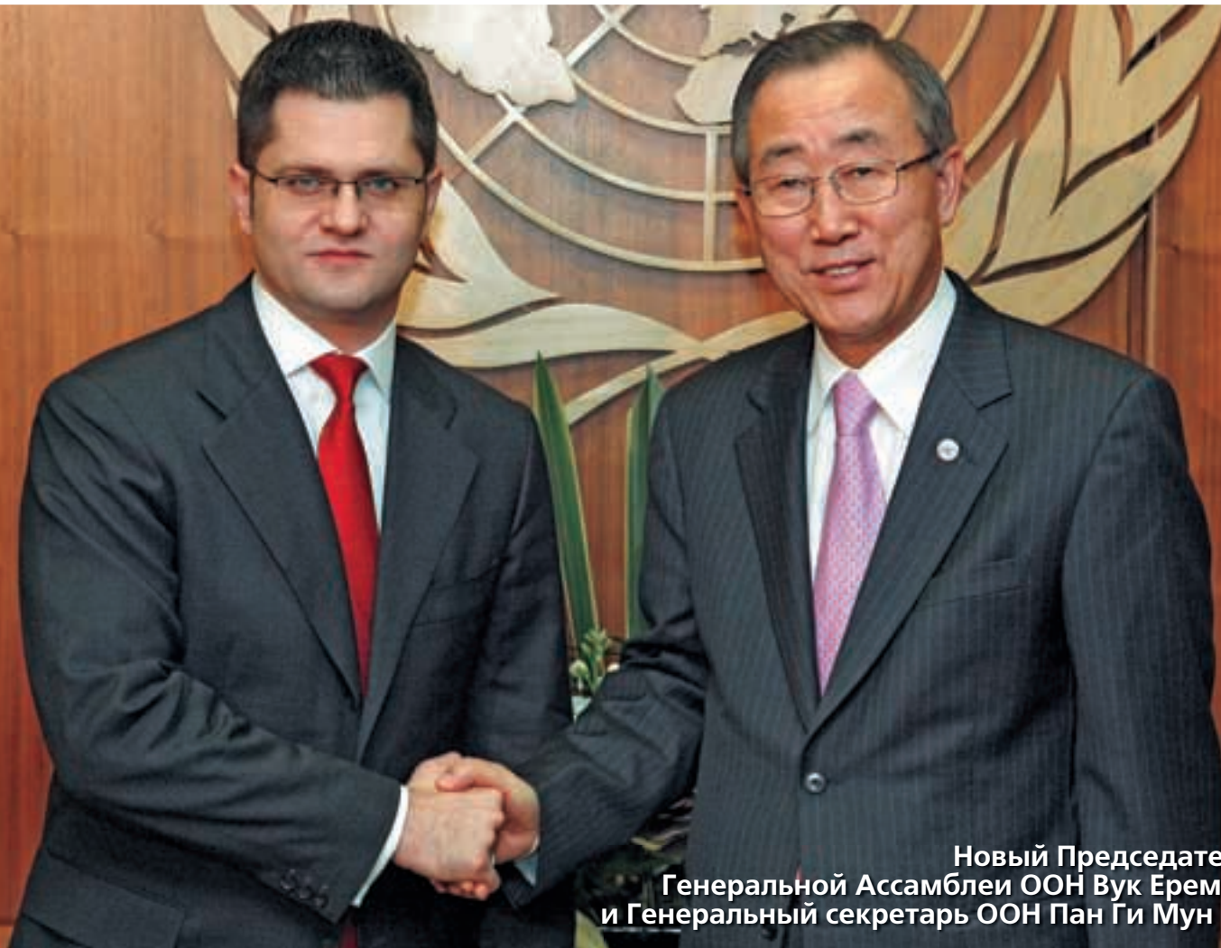
Новый Председатель Генеральной Ассамблеи ООН Вук Еремич и Генеральный секретарь ООН Пан Ги Мун /3

Издается Представительством Организации Объединенных Наций в Российской Федерации