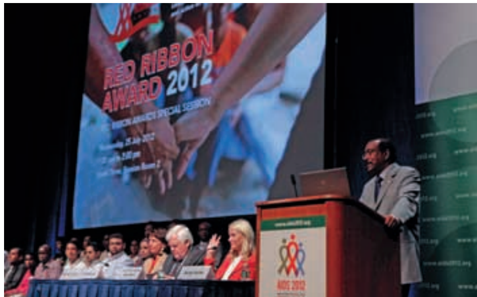
Исполнительный директор ЮНЭЙДС Мишель Сидибэ выступает на церемонии Red Ribbon Award (Премия «Красная лента») во время специальной сессии на Международной конференции по СПИДу в Вашингтоне, округ Колумбия, 25 июля 2012 года

Премия вручена за инновационные меры по противодействию СПИДу во время Международной конференции по СПИДу в Вашингтоне.