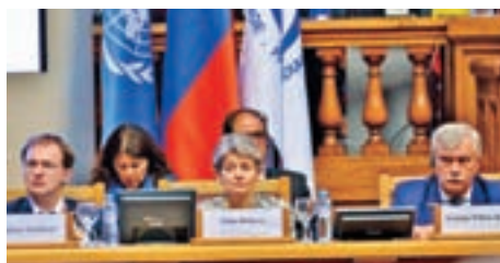
Владимир Мединский, Ирина Бокова и Георгий Полтавченко на открытии 36-ой сессии Комитета Всемирного наследия

В 2012 году исполняется 40 лет Конвенции Организации Объединенных Наций по вопросам образования, науки и культуры (ЮНЕСКО) об охране Всемирного культурного и природного наследия. Этой знаменательной дате была посвящена 36-ая сессия Комитета Всемирного наследия ЮНЕСКО, которая прошла с 24 июня по 6 июля в Санкт-Петербурге.