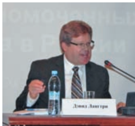
Исполняющий обязанности Председателя Канадской комиссии по правам человека Дэвид Лангтри

Канадской комиссии по правам человека Дэвида Лангтри на тему «Роль Международного координационного комитета (МКК) в развитии и укреплении Национальных правозащитных учреждений». Он кратко рассказал о том, что такое МКК, какова его роль в создании и укреплении НПЗУ в соответствии с Парижскими принципами, как происходит процесс аккредитации НПЗУ и как правозащитные учреждения взаимодействуют с международными и региональными механизмами. «Международный координационный комитет аккредитует лишь одно правозащитное учреждение от каждой страны, но это не означает, что правозащит-