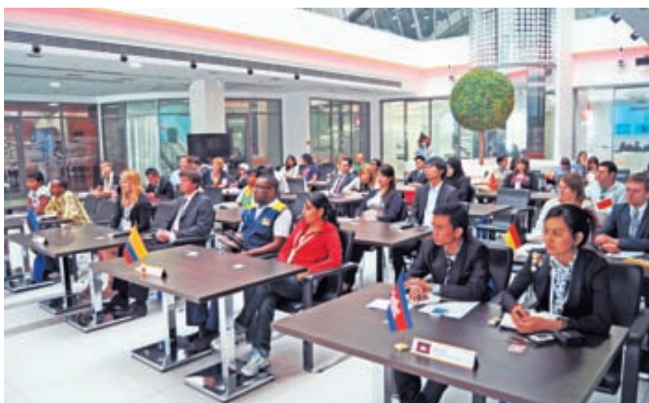
Телемост Молодежной модели с участниками 36-ой сессии Комитета Всемирного наследия

40-летний юбилей Конвенции ЮНЕСКО об охране Всемирного наследия совпал с еще одним важным