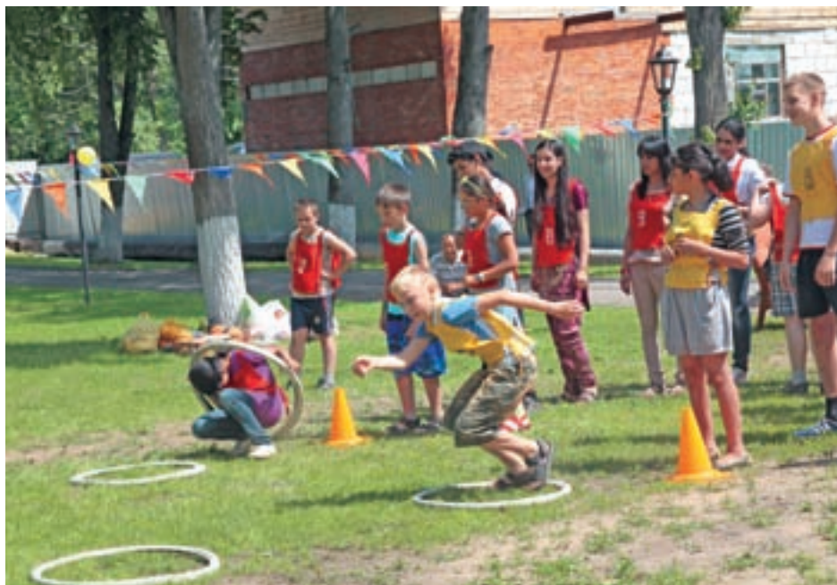
Для этих детей Всемирный день беженцев стал настоящим праздником

Другой важный проект, завершённый накануне Всемирного дня беженцев – опрос общественного мнения об отношении к беженцам и информированности о положении беженцев. Опрос проводился УВКБ ООН в 11 странах мира, включая европейские страны, Австралию, ЮАР и Россию. Предварительные резуль-