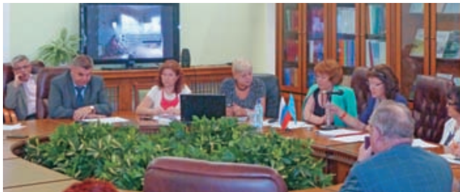
Официальные празднования по поводу Всемирного дня беженцев проходили в Москве, в Российской государственной библиотеке