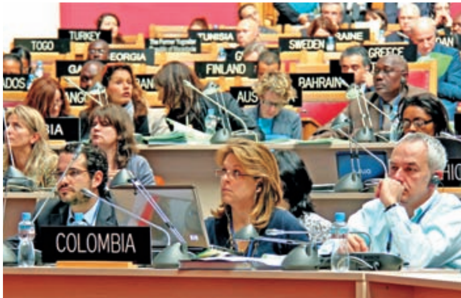
Участники 36-ой сессии Комитета по Всемирному наследию

Однако состояние 5 других объектов вызвало озабоченность Комитета. Он включил в Список Всемирного наследия, находящегося под угрозой, увеличив его до 38 объектов, Тимбукту и гробницу Аския (Мали), место рождения Иисуса Христа: Базилика Рождества Христова и тропы