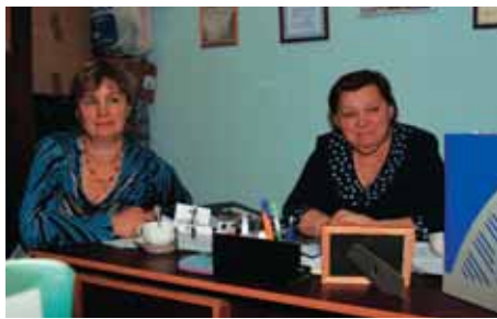
Сотрудники Фонда «Теплый дом»

Эксперты ЮНИСЕФ убеждены, что родная семья является наиболее