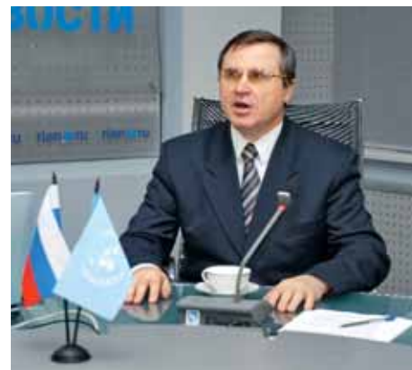
Депутат Госдумы РФ Олег Смолин

Вступительным словом конференцию открыл депутат Госдумы Олег Смолин. Декада инвалидов, что в декабре отмечается во всем мире, сказал он,