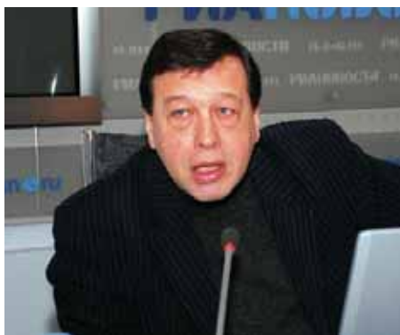
Профессор Евгений Гонтмахер

закона, согласно которому фактически отменили платежи, которые делал работодатель, если он не выбирал квоту по трудоустройству инвалидов. Повысили лимит при том, что малое предприятие насчитывает от 30 до 100 человек, а мы же знаем прекрасно, что значительная часть инвалидов трудоустроена на очень небольших предприятиях. Получается так, что работодатель действительно может не выбирать эту квоту. Формально эти квоты существуют, и каждый регион их устанавливает, но работодатель за это не несет ответственности. До принятия 122-го закона работодатели платили определенный взнос, были специальные фонды во многих регионах, из которых как раз и создавали рабочие места