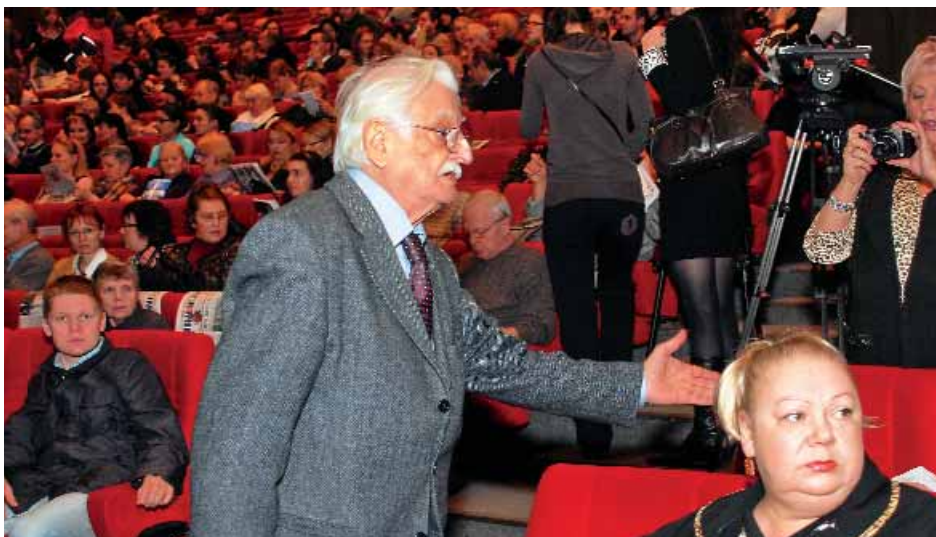
Президент Гильдии кинорежиссеров России Марлен Хуциев рассказывает гостей

Интересно была организована церемония открытия фестиваля. В фойе Дома кино разместилась фотовыставка «ООН в России», посвященная работе учреждений ООН в нашей стране, и были представлены публикации ООН, в том числе текст Всеобщей декларации прав человека, которые гости фестиваля могли взять с собой. По инициативе УВКПЧ ООН, Почта России выпустила к 60-летию Декларации юбилейный конверт и в течение дня открытия фестиваля разрешила использовать специальный штамп для его гашения. Гашение происходило в фойе Дома кино, и все желающие могли взять на память проштампованные конверты. Со сцены перед зрителями выступили организаторы и спонсоры фестиваля,