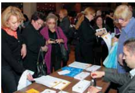
Гости фестиваля берут на память конверты с юбилейным гашением

10 декабря 2008 г. во всем мире отмечалось 60-летие Всеобщей декларации прав человека, принятой Генеральной Ассамблеей ООН в 1948 г. в Париже. В этот день началась недельная программа Международного фестиваля фильмов о правах человека «СТАЛКЕР», который традиционно пользуется поддержкой ООН.