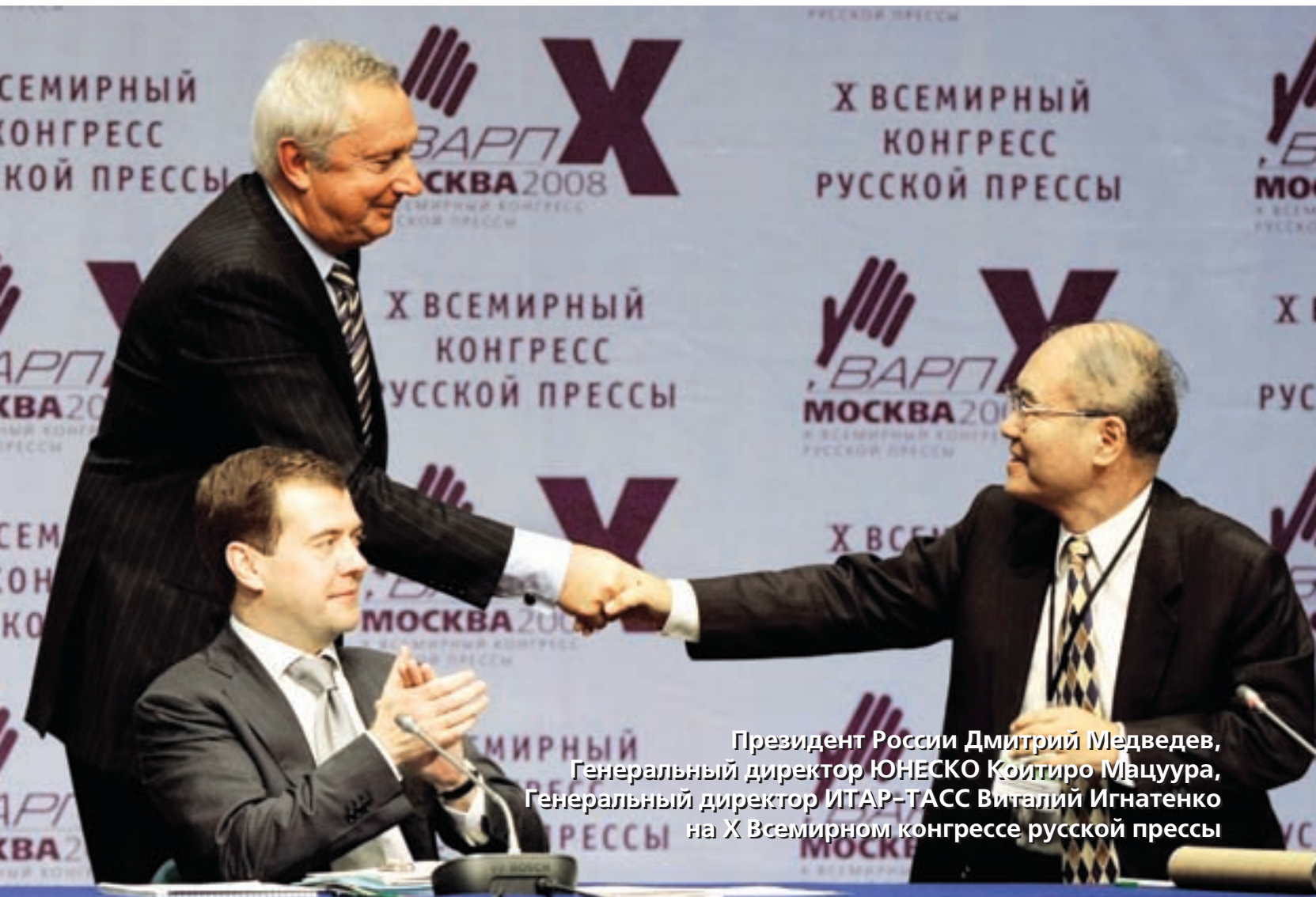
Президент России Дмитрий Медведев, Генеральный директор ЮНЕСКО Коитиро Мацуура, Генеральный директор ИТАР-ТАСС Виталий Игнатенко на X Всемирном конгрессе русской прессы

От экономического роста к устойчивому социальному развитию, основанному на правах человека