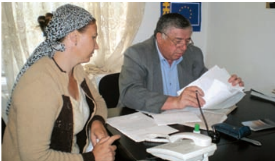
В Консультационном центре МОО «Веста» города Грозного

В октябре 2007 года УВКБ ООН организовало семинар на тему «Международные и внутренние механизмы правовой защиты перемещенного на-