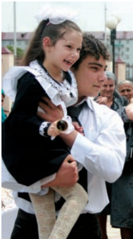
Открытие новой школы

мин, социально-психологическая реабилитация, а также программа по укреплению мира и толерантности. Перечисленные проекты осуществляются в пяти республиках Северного Кавказа: Чечне, Ингушетии, Северной Осетии-Алании, Дагестане и Кабардино-Балкарии.