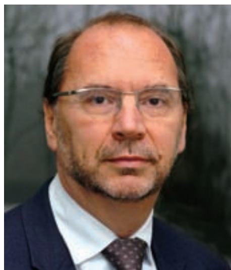
Доктор Питер Пиот

«Борьба с ВИЧ часто затрагивает такие сферы, где государство не работает и нет механизмов, способных его привлечь. Именно туда должен прийти бизнес», - говорит заместитель Генерального секретаря ООН Питер Пиот