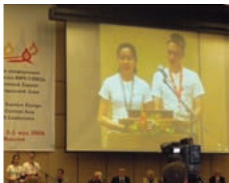
Участники «Молодёжной деревни» зачитывают свое обращение

1. Признать, что молодёжь представляет разнородную группу с различной степенью уязвимости и риска по отношению к ВИЧ инфекции.