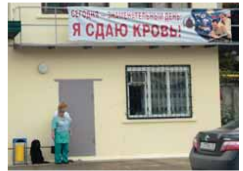
Краснодарская краевая станция переливания крови