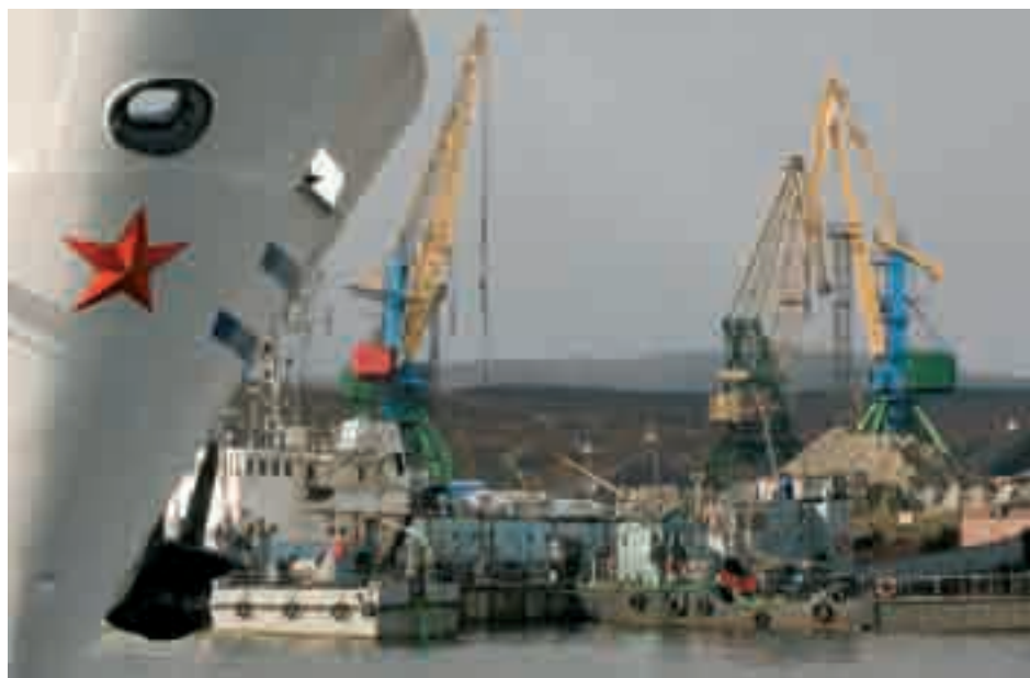
Мурманский торговый порт