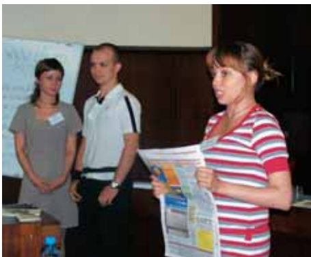
Участники семинара для журналистов