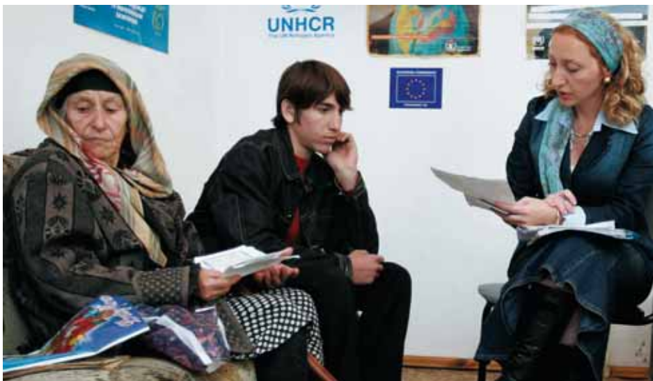
В Консультационном центре Межрегиональной общественной организации «Веста», г. Грозный, Чеченская республика

– Как долго, по Вашему мнению, гуманитарные агентства, в том числе Агентство ООН по делам беженцев, будут продолжать предоставлять правовую защиту на Северном Кавказе?