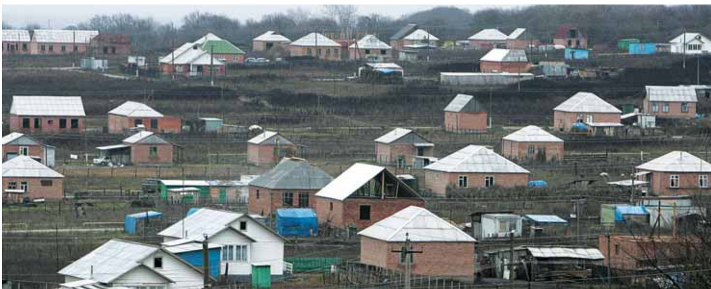
Жилищная программа УВКБ ООН в Ингушетии призвана содействовать интеграции лиц, перемещенных внутри страны. Берт-Юрт, Республика Ингушетия