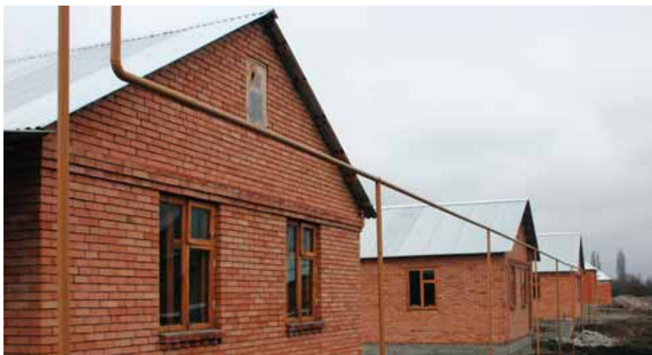
Новые дома для беженцев в Ардонском районе, построенные при содействии УВКБ ООН и Швейцарского агентства развития и сотрудничества в Республике Северная Осетия-Алания

– За нашу безопасность несет ответственность правительство. Мы можем работать во всех республиках.