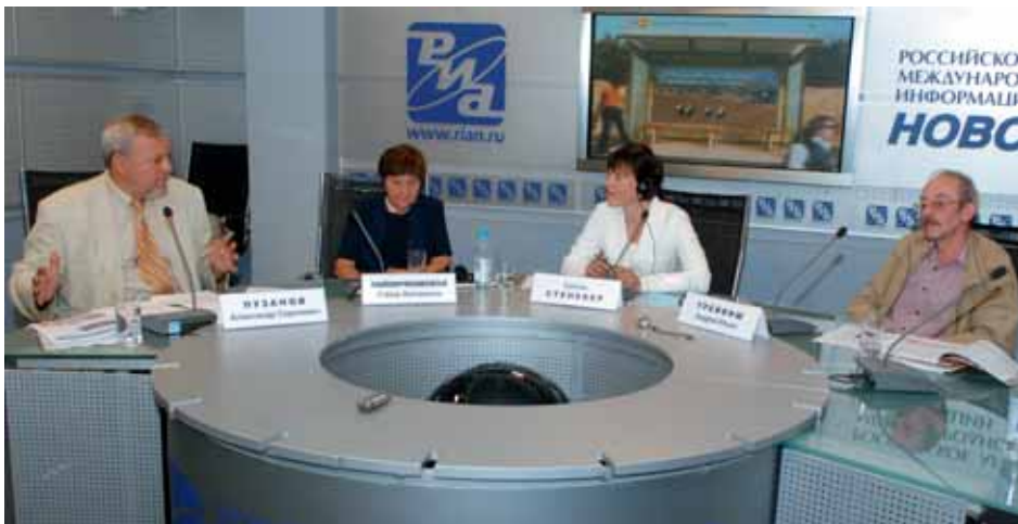
Пресс-конференция по случаю презентации Доклада Фонда ООН в области народонаселения