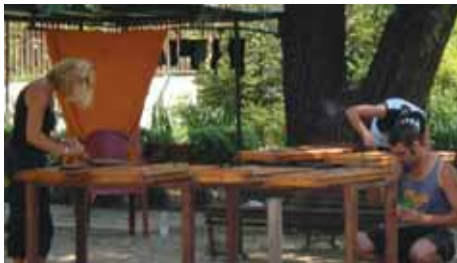
Трудотерапия в ассоциации «Саман»

новационного проекта – установки аппаратов по обмену шприцов в различных районах Милана.