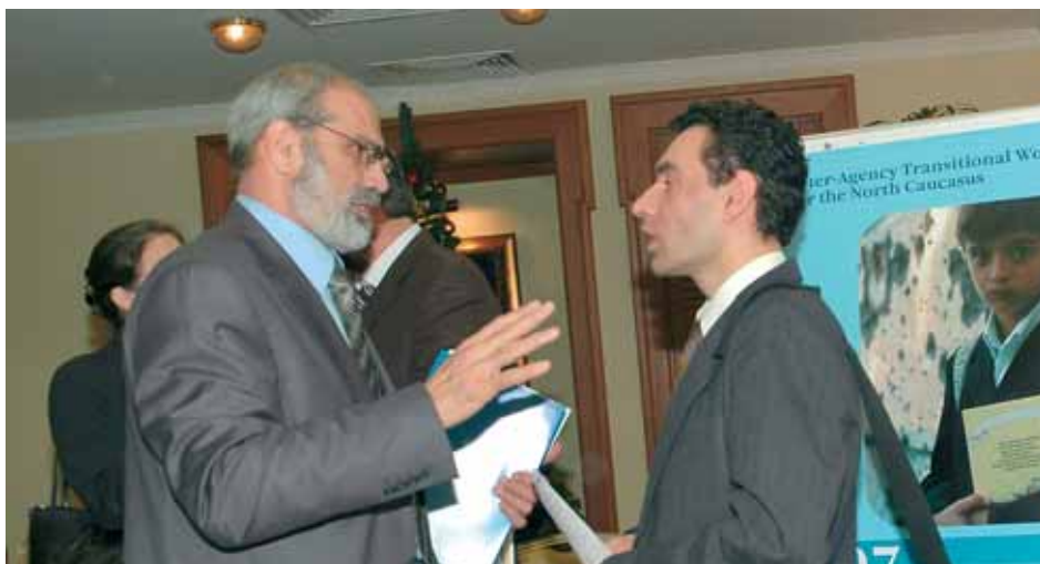
Оживленные беседы не прекращались и с завершением презентации

И так, оценка ситуации показывает, что в 2007 году общая гуманитарная ситуация в Чечне и соседних республиках останется серьезной, но признаки ее улучшения заметны уже сейчас, и есть основания ожидать положительного развития этой тенденции.