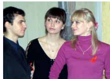
Студенты Академии им. Сеченова

Сотрудники кафедры эпидемиологии организовали викторину, позволившую оценить знания студентов-медиков по вопросам патогенеза, профилактики и лечения ВИЧ/СПИДа. Из девушек и юношей, правильно отве-