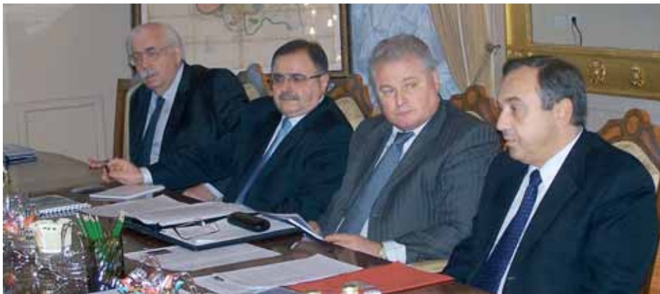
Участники встречи Ада Мелкерта с Правительством Москвы

В завершение визита Ад Мелкерт встретился со страновой командой ООН, чтобы обсудить последний доклад Группы высокого уровня по повышению согласованности системы ООН. Г-н Мелкерт отметил согласованность деятельности агентств ООН в России, особенно работу ЮНЭЙДС, и содействие постконфликтному восстановлению на Северном Кавказе.