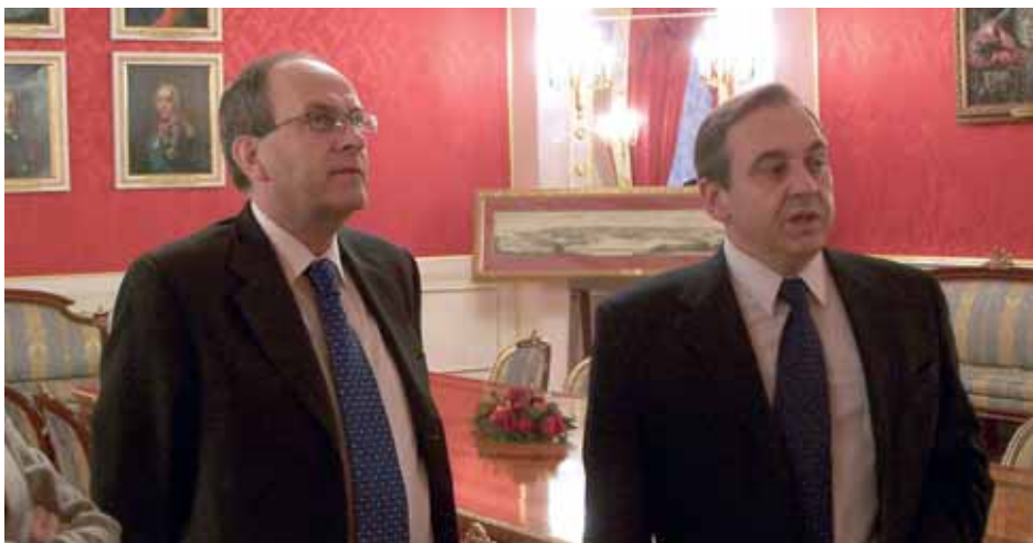
Ада Мелкерта (слева) принял в столичной мэрии директор Департамента международных связей Правительства Москвы Георгий Мурадов

Заместитель министра иностранных дел Александр Яковенко на встрече с г-ном Мелкертом рассказал о заинтересованности России как в получении, так и в предоставлении содействия в области