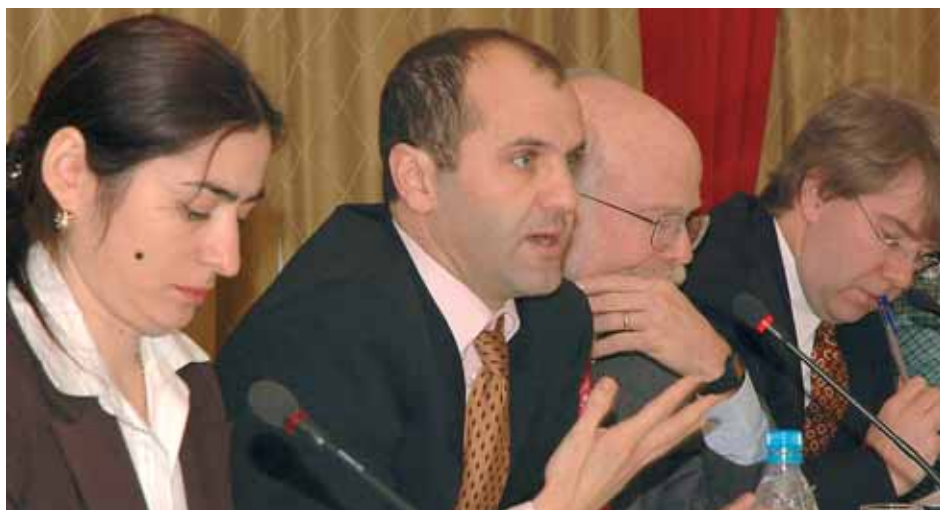
Представители стран-доноров ...

Организации-участницы планируют осуществить проекты, направленные на социально-экономическое восстановление и развитие в рамках секторов экономического роста и борьбы с бедностью, управления, миротворческого образования и формирования толерантности. Намечена реализация проектов, направленных на оказание гуманитарной помощи и восстановление в рамках секторов образования, продовольст-