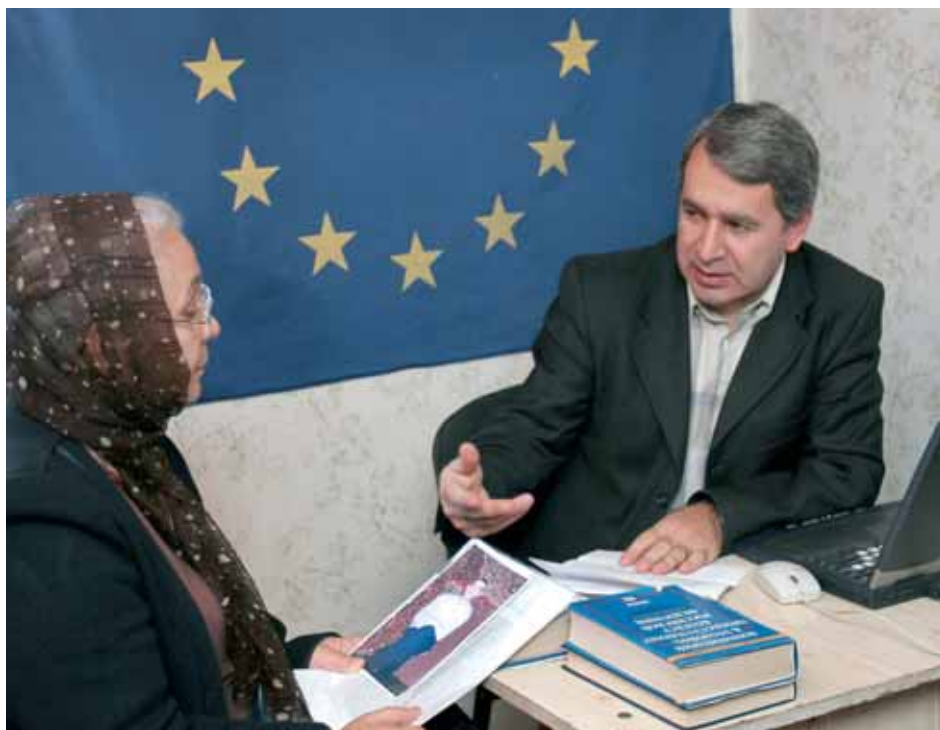
Чеченская Республика, Урус-Мартан: в Консультационном центре Правозащитного центра «Мемориал»

Управление Верховного Комиссара ООН по делам беженцев