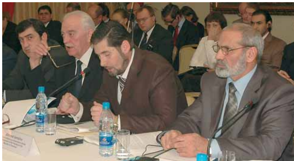
... и руководства республик Северного Кавказа

Н а реализацию совместной программы на 2007 год Организации Объ-