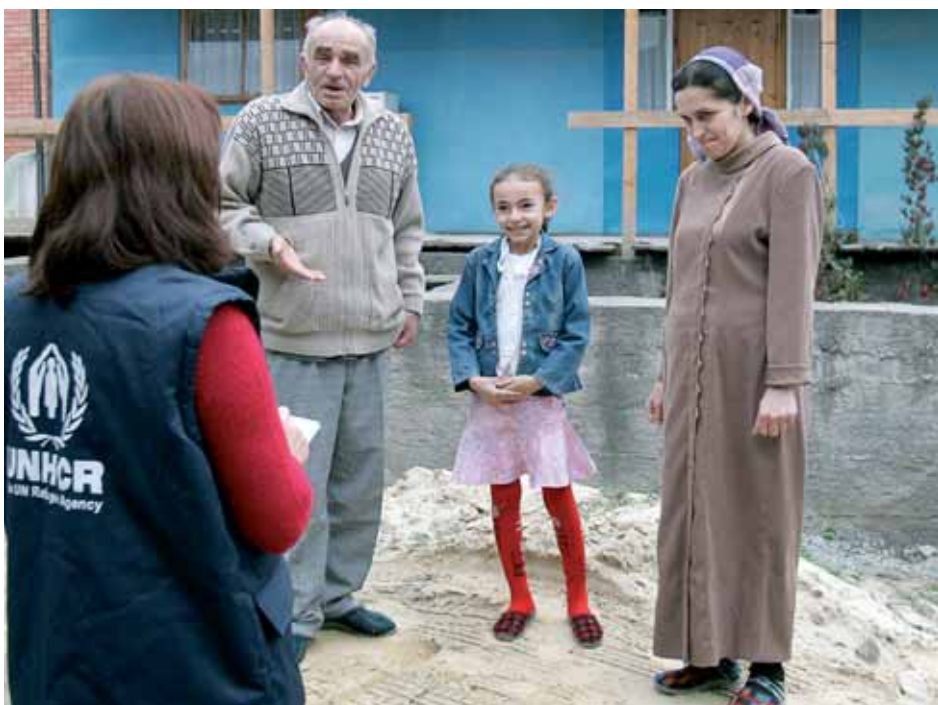
Республика Ингушетия: сотрудник Благотворительного фонда «Кавказский совет по беженцам» посещает чеченскую семью, которая живет в сборно-щитовом домике, предоставленном УВКБ ООН

Глава Бюро по гуманитарной помощи, Европейская Комиссия, Московский офис