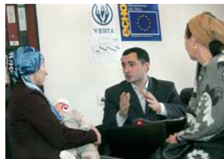
Республика Ингушетия, Назрань: в Консультационном центре Межрегиональной общественной организации «Веста»

С тоит отметить, что Европейская Комиссия является активным донором. Сотрудники Бюро по гуманитарной помощи часто посещают реги-