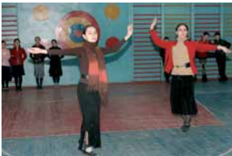
Отремонтированный спортзал в одной из школ Грозного

Введение в действие в 2006 году Межучрежденческого плана работы в условиях переходного периода на Северном Кавказе, предусматривающего сочетание гуманитарных программ и программ вос-