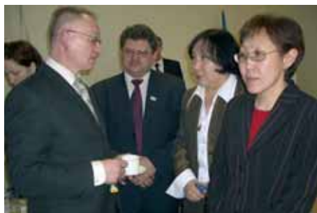
Участники конференции не прекращали оживленную дискуссию даже во время перерыва