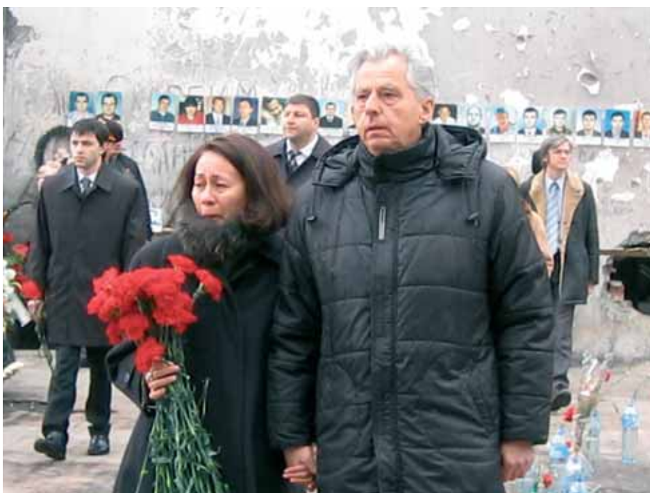
Французский посол и его супруга в школе №1 в Беслане (Автор снимка – 18-летний Ваню Вазагов из Беслана, который научился фотографировать на семинаре, организованном ЮНИСЕФ)