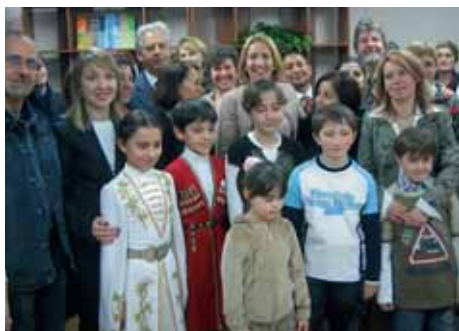
Гости, присутствующие на открытии Семейного реабилитационного центра

Трагические события в Беслане имели глубокое психологическое воздействие на родителей, и спустя 18 ме-