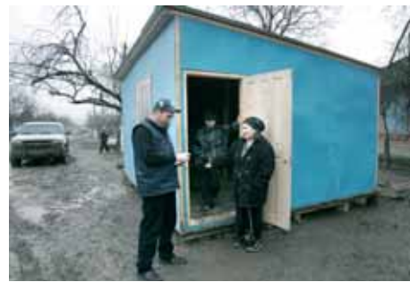
В 2005 году УВКБ ООН предоставило 222 сборных домика чеченским семьям, вернувшимся домой

- Как складывается ситуация с безопасностью сотрудников УВКБ ООН, работающих на Северном Кавказе?