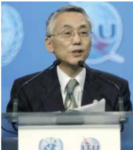
Генеральный секретарь Международного союза электросвязи, Председатель ВСИО Иосио Юцуми

ласованный на предыдущем этапе Саммита в Женеве в 2003 году тезис о том, что информация и коммуникационные технологии являются ключевым инструментом национальных стратегий развития. Поэтому финансирование прогресса ИКТ и их передачи беднейшим государствам мира является жизненно важным для достижения Целей развития тысячелетия (ЦРТ). Участники Саммита приветствовали создание «Фонда цифровой солидарности», а также определили круг областей, в которых можно было бы добиться более эффективного функционирования финансовых механизмов, в том числе на основе таких уже существующих финансовых обязательств, как «Монтеррейский консенсус».