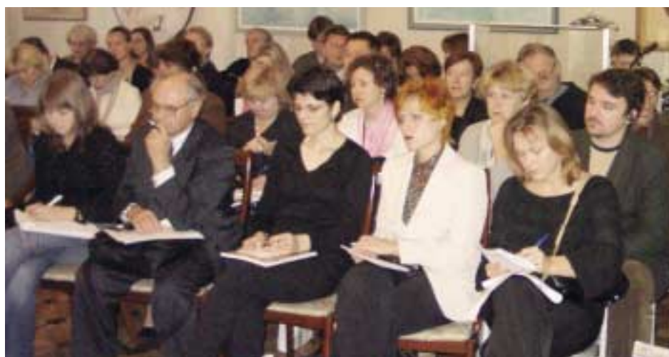
В пресс-конференции приняли участие представители правительства, международных организаций, ученые и журналисты из 20 регионов России