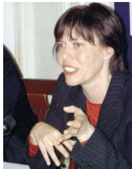
Представитель ЮНФПА в Российской Федерации Ситске Стенекер

В заключение Ситске Стенекер отметила: «Сегодня у нас есть возможность воплотить в жизнь обещания, которые были сделаны более четверти века назад и верность которым неоднократно подтверждалась на протяжении всех 90-х годов - в Каире