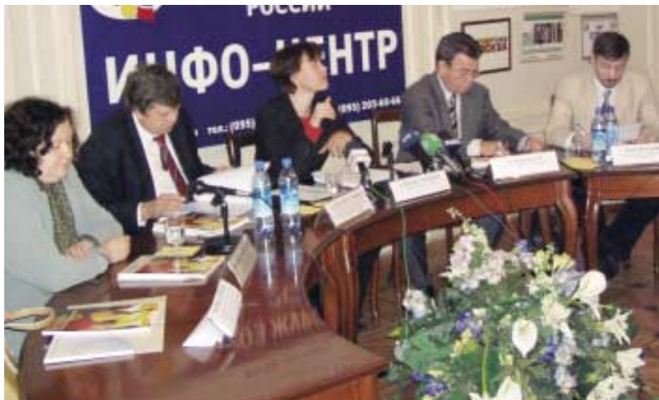
Презентация ежегодного Доклада ЮНФПА в Центральном доме журналиста

12 октября 2005 года в Центральном доме журналиста в Москве прошла пресс конференция, посвященная презентации ежегодного Доклада ЮНФПА о состоянии народонаселения мира, озаглавленного: «Обещание равенства: Равенство между мужчиной и женщиной, репродуктивное здоровье и Цели развития тысячелетия». В этом году издание Доклада совпало с 60-й годовщиной принятия Устава Организации Объединенных Наций, в котором, помимо прочего, были письменно зафиксированы равные права женщин и мужчин.