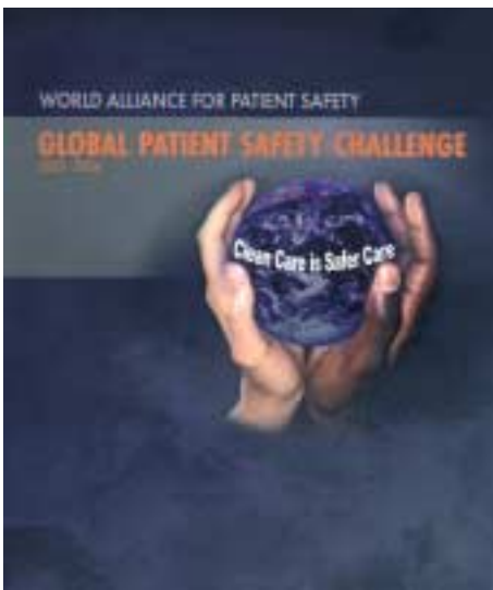
Брошюра ВОЗ, посвященная безопасности пациентов

В любой системе здравоохранения не исключены отдельные случаи непреднамеренного причинения вреда здоровью пациентов. В результате всё большее число стран считает обеспечение безопасности пациентов важным политическим приоритетом. В 2002 году 55-я Ассамблея ВОЗ приняла резолюцию с призывом ко всем странам уделять самое пристальное внимание укреплению безопасности и развитию систем мониторинга в здравоохранении. Это послужило импульсом к переводу безопасности пациентов в разряд глобальных проблем.