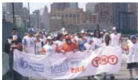
Соединенные Штаты Америки

Не обошли праздник стороной официальные лица и знаменитости. Например, президент Гондураса Рикардо Мадуро возглавил Марш в столице стра-