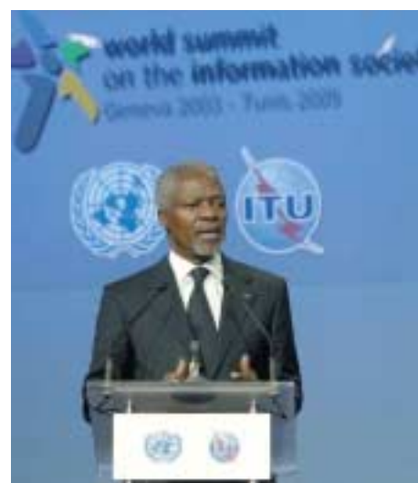
Генеральный секретарь ООН Кофи Аннан обращается к участникам Всемирной встречи

Техника, информация, коммуникационные технологии – это фон, среда, контекст, а сердцевинным понятием являются все же люди, их потенциал и их проблемы, прежде всего, проблема неравенства. Поэтому главной целью встречи в Тунисе было обеспечить, чтобы бедные страны и малоимущие во всех странах в