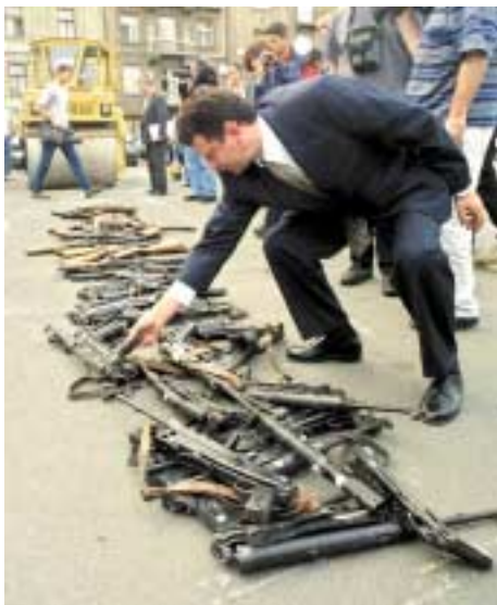
Сдача стрелкового оружия для уничтожения в рамках проекта ПРООН в Сербии и Черногории

- Что нужно делать, чтобы помочь стране встать на путь устойчивого