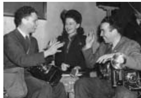
Перевод беседы советского фотографа с офицером связи США

- Нет. Это пришло позже – сознание того, что было сделано. А тогда просто была работа.