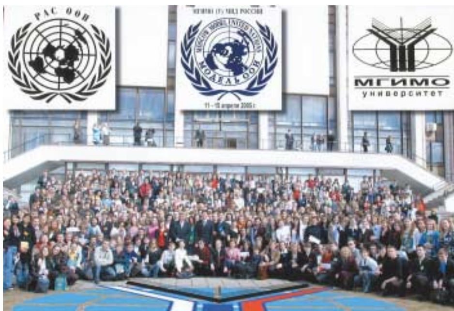
Участники Московской международной модели ООН

О собый интерес представляют ежегодные Московские международные модели ООН. Эти конференции – ролевые игры, в ходе которых имитируются заседания органов ООН. Девушки и юноши люди из разных регионов России и стран мира обсуждают вопросы повестки дня реальной Организации Объединенных Наций в соответствии с правилами процедуры, принятыми в ООН. Итогом совместной пятидневной работы становится резолюция, которая является компромиссом между позициями стран-участниц. Последние годы Московская Модель ООН традиционно собирает более 800 делегатов и признана одной из лучших в мире.