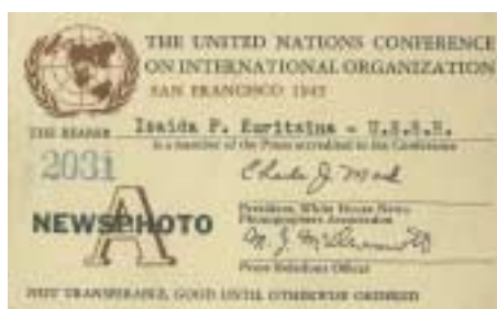
Удостоверение представителя прессы на имя Ираиды Курицыной

- Мы жили далеко от центра, в каком-то парке, в особняке. Мы с подружкой Раечкой – в одной комнате. Питание было там организовано: кухня, или столовая, или рестораник... Нас только мы были заняты, что на это как-то не обращали внимания. Потому что все время шла напряженная работа, в таком темпе ... Конечно, нам давали какой-то перерыв, и иногда мы все-таки куда-то ходили, что-то покупали. Вот я купила себе кофточку. Но это, понимаете, было очень редко. И нам, конечно, платили какие-то деньги, но сколько – не помню. У меня там сохранилось в памяти, когда кончилась война наша: оттого, что жили мы где-то за городом, я только видела фейерверки.