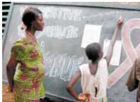
Школа для детей, потерявших родителей, которые болели СПИДом. Буркина-Фасо, 2002 год

развития? И, напротив, чего делать ни в коем случае нельзя?