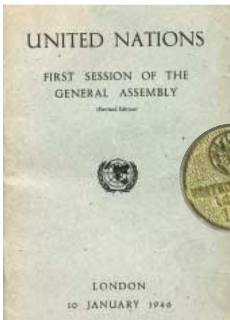
Список стран-участниц и значок участника Первой сессии Генеральной Ассамблеи

- Да нет, в общем-то, была такой же. Но уже появился опыт. Когда я была там, кончилась война с японцами. Вы знаете, что тут было? Мы жили на Пикадилли-стрит...Тут была Ходынка! Народу много, солдат много, всех обнимают, целуют! И все друг с другом целуются...Так для меня кончилась вторая мировая война.