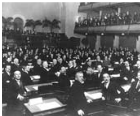
Первое заседание Лиги Наций. Женева, 1920 год

Вообще я видел три разных периода в жизни Организации. Первый, скажем, с 1954 до 1964 года. Это было время «холодной войны». ООН, по существу, не работала в соответствии со своим Уставом. Это была не организация по сотрудничеству, а организация по недружественным отношениям. Несколько десятков государств были расколоты на два неравноценных лагеря. Небольшой лагерь – Советский Союз и Варшавский договор и довольно большой лагерь – Соединенные Штаты и их союзники. И шло сплошное политическое препирательство, люди руга-