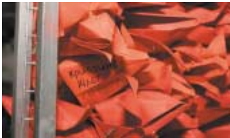
Во время всероссийской кампании «Красные тюльпаны надежды» люди делали бумажные цветы в знак поддержки борьбы с ВИЧ/СПИДом

лен на усиление координации между различными секторами, ведомствами и организациями, реализующими мероприятия по борьбе с эпидемией. Основными компонентами проекта являются разработка единой стратегии по борьбе со СПИДом, улучшение взаимодействия между государственным сектором, организациями гражданского общества (в том числе сообществами людей, живущих с ВИЧ), бизнес-структурами и международными организациями, а также единая система мониторинга и оценки, призванная сделать процесс противодействия эпидемии понятным и прозрачным.