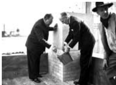
Генеральный секретарь ООН Трюгве Ли и главный архитектор У. Харрисон закладывают первый камень здания штаб-квартиры ООН. Нью-Йорк, 1949 год

Но не так-то просто было с Генеральной Ассамблеей, где шли разговоры: пусть русские становятся в очередь и вступают заново. Председатель Генеральной Ассамблеи даже запросил мнение Международного Суда в Гааге. На наше счастье, тот отказался заниматься хитросплетениями и ответил, что это дело Генассамблеи – как она