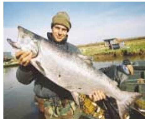
ПРООН помогает сохранить уникальные запасы лососевых на Камчатке

- Наверное, мои самые яркие и радостные впечатления связаны с работой в Кыргызстане. Я занимался открытием представительства ООН в этой стране сразу после обретения ею независимости. Как и многие другие республики, Кыргызстан пострадал от распада Советского Союза, так как половина бюджетных средств республики предоставлялась Москвой. Они потеряли всех своих торговых партнеров, большинство из которых составляли бывшие советские республики. Это были очень тяжелые времена. Но они боролись, много работали, смогли преодолеть ряд трудностей, хотя немало проблем остались нерешенными. Я мог наблюдать за тем, с каким энтузиазмом было воспринято открытие офиса ООН, международной организации, на которую они надеялись в этот непро-