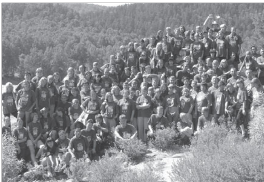
В этом году Летняя школа добровольцев собрала 118 человек из 22 регионов России на Горном Алтае

Профилактика ВИЧ/СПИДа и внедрение здорового образа жизни среди молодежи входят в число приоритетных направлений деятельности ЮНИСЕФ в Российской Федерации в соответствии с Целями развития тысячелетия.