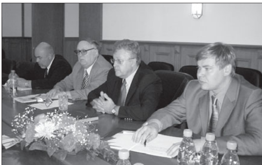
...и хозяева: представители Российской ассоциации содействия ООН и Московского государственного института международных отношений

В этот же день состоялась официальная встреча в Министерстве иностранных дел Российской Федерации с директором Департамента международных организа-