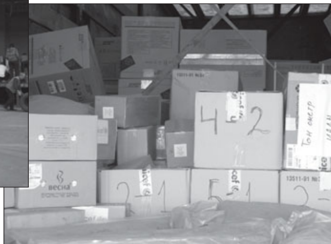
ЮНИСЕФ доставил 20 тонн медицинских принадлежностей в больницы Беслана и Владикавказа для помощи пострадавшим детям