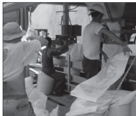
Российская пшеница доставлена в КНДР, где ВПП ООН оказывает чрезвычайную помощь 6 миллионам человек

Прибывшая российская пшеница будет использована для оказания продовольственной помощи