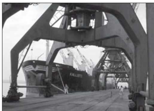
Судно «Каллисто» доставило партию гуманитарной продовольственной помощи из Новороссийска в Корейскую Народно-Демократическую Республику