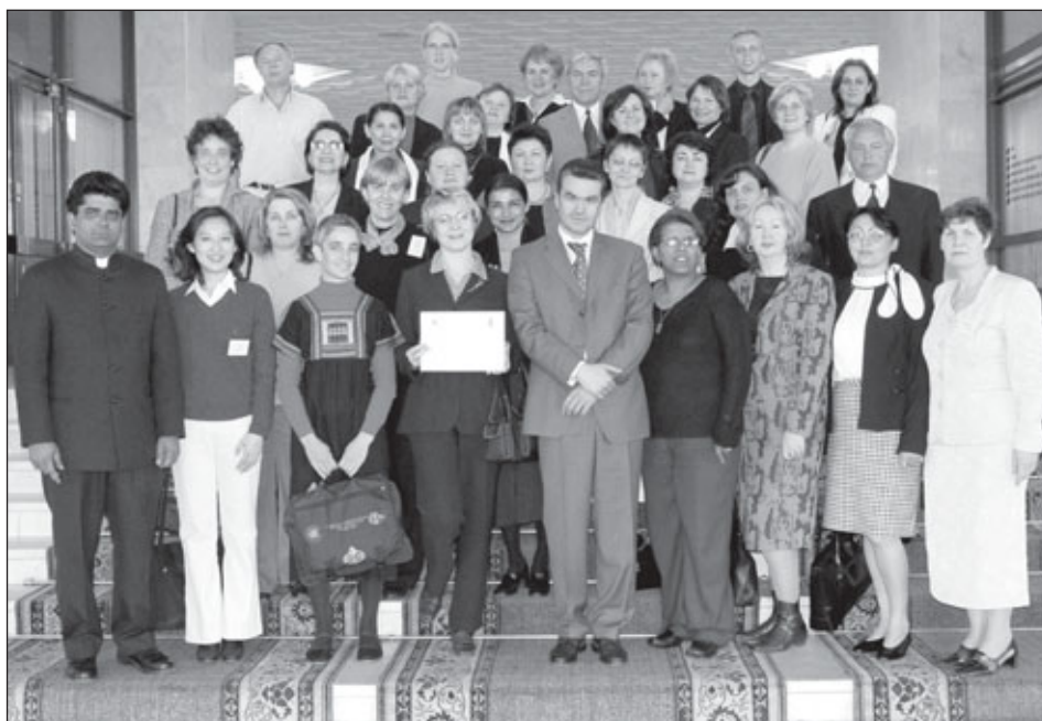
Участники Международного семинара по гендерным бюджетным инициативам

Проведение семинара в Москве стало возможным благодаря поддержке со стороны глобального проекта «Гендерные бюджетные инициативы: инвестирование в беднейшие категории женщин для достижения Целей в области развития, сформулированных на Саммите тысячелетия», который финансируется Фондом «Женщины в развитии» (Япония) и управляется ПРООН.