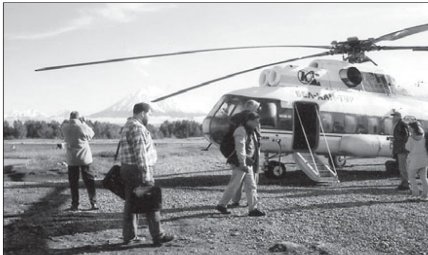
Сотрудники экологического отдела ПРООН на Камчатке

– Всего в нашей экологической программе насчитывается 16 проектов. Но это включая те, которые еще только готовятся, а уже реализуемых – 8. Мы заблаговременно заботимся о том, чтобы «порт-