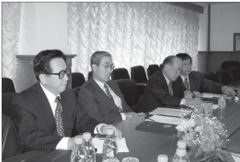
Гости: делегация Ассоциации содействия ООН Республики Корея...

С 4 по 11 июля 2004 года состоялся визит делегации Ассоциации содействия ООН Республики Корея в Российскую Федерацию по приглашению Российской ассоциации содействия ООН. Делегацию возглавлял Председатель АСООН РК, Чрезвычайный и Полномочный Посол Пак Су-джил.